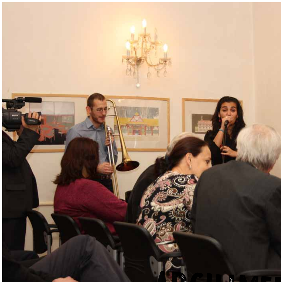
Program na odovzdávaní cien