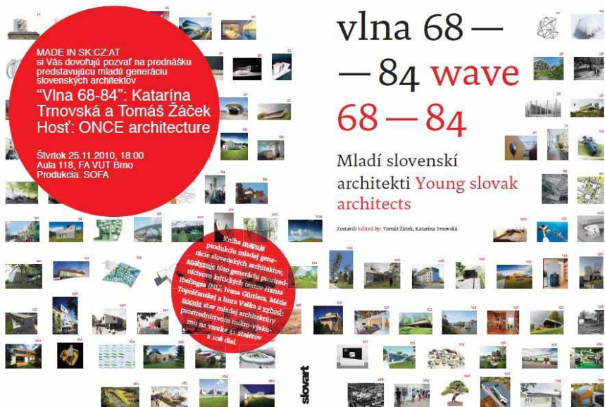
Obal knižky vlna 68 - 84