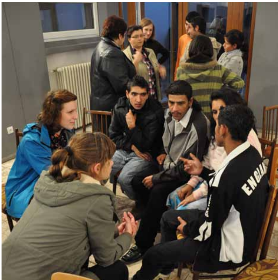
Diskusie po záverečnej prezentácii