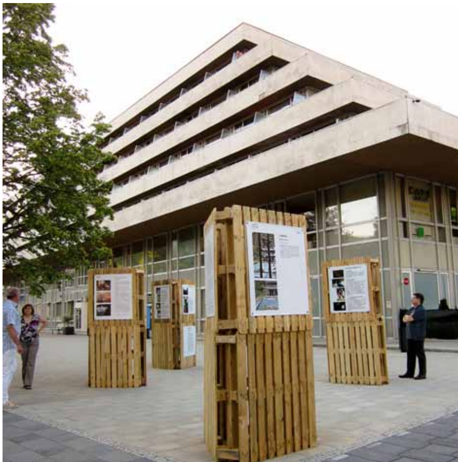
Výstava na promenáde v Trenčiankych Tepliacich