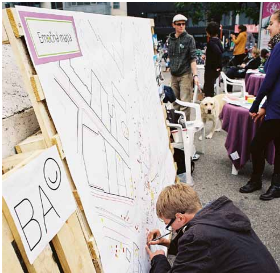
Emočná mapa počas dňa pre námestie