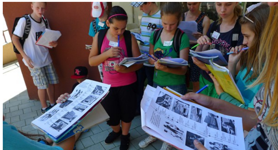
Workshop s deťmi zo základných škôl