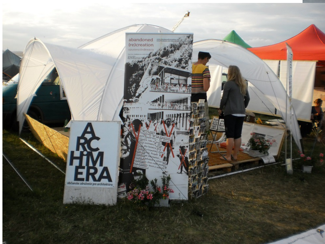
< Stánok Archimeri na Pohode