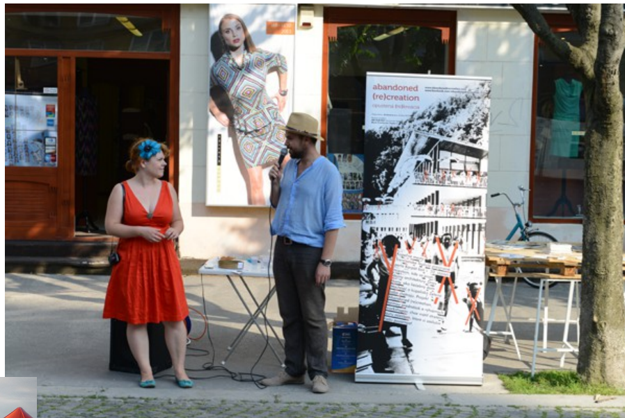
Z výstavy na námestí v Trenčíne

Projekt Opustená (re)kreácia však emanuje ďalej; počas hudobného festivalu Pohoda bolo výstava venovaná téme projektu nielen v stánku Archimeri v sektore neziskových organizácií (kde sa Archimera rozložila prvýkrát) ale aj priamo na námestí v meste Trenčín. Výstava sa však začiatkom roku 2014 objaví aj v Prahe.